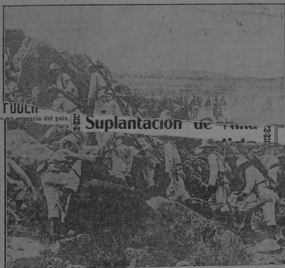
MARRUECOS.—Tropas españolas tomando una importante posición a los moros.